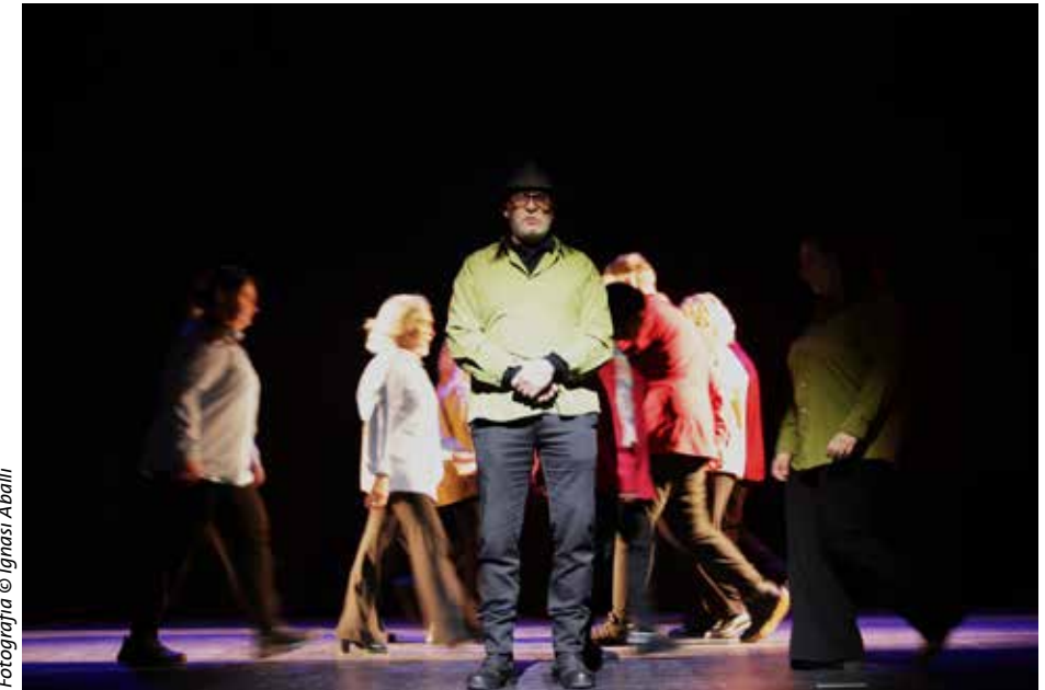
Fotografia © Ignasi Aballí

Som conscients que la societat ens modela? Creieu que el món que hem construït va massa ràpid i ens hem oblidat les unes de les altres?