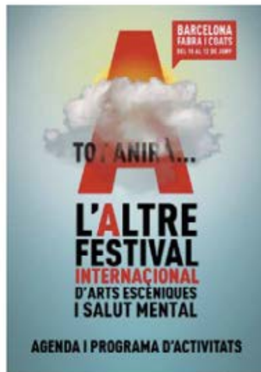
Cartell de L'Altre Festival Internacional d'Arts Escèniques i Salut Mental

L'Altre Festival sortirà novament als carrers de Barcelona amb la compositora japonesa Reiko Yamada i La Trifulga dels Fútils. Una processó diferent i una coproducció del Festival Mixtur i l'Altre Festival el dia 10 de juny a les 20.30 h. Serà l'espectacle inaugural.