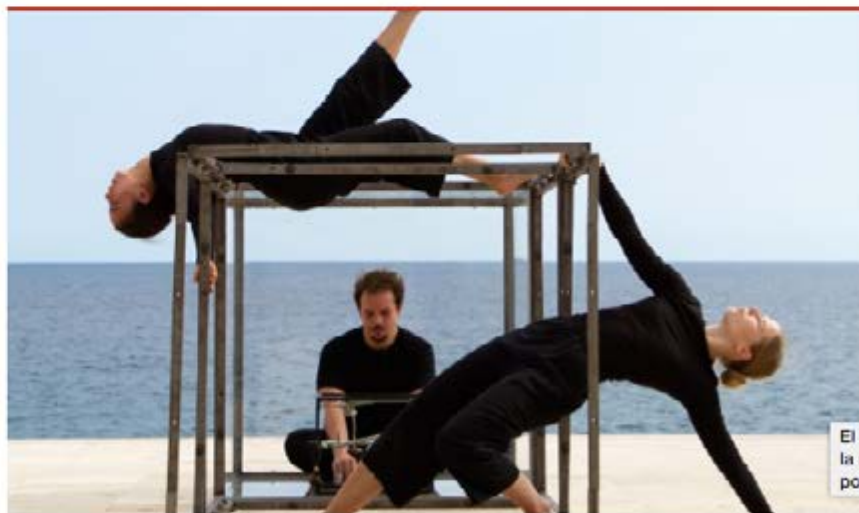
El festival la salut positiu

El festival pretén donar a conèixer la realitat de la salut mental a la societat des d'un vessant positiu i inclusiu.